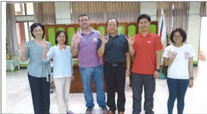
1080418 和興外師訪視合影