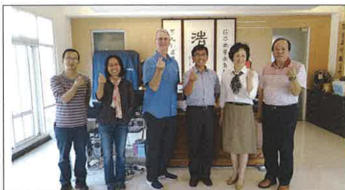
1071029 安東國小外師訪視合影