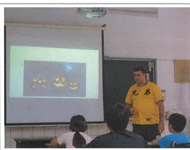
1071112 黎明外師訪視觀課 1