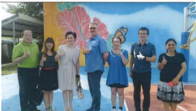
1070510 大崙國小外師訪視合影