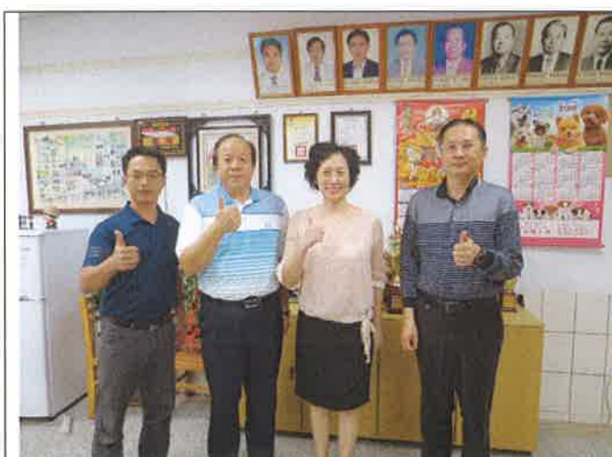
1071112 黎明外師訪視合影