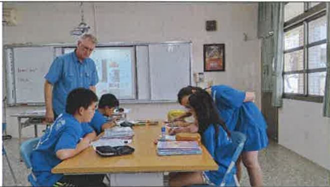
1070510 大崙國小外師訪視觀課 2