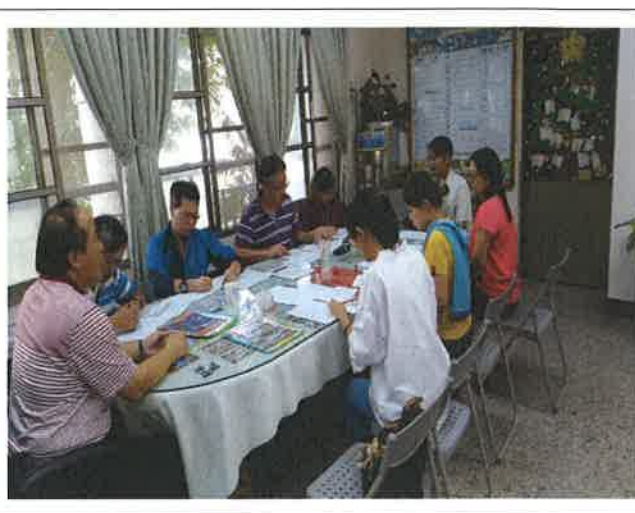
英語單字比賽評審會議