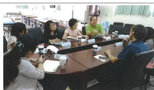
1071112 祥和外師訪視座談