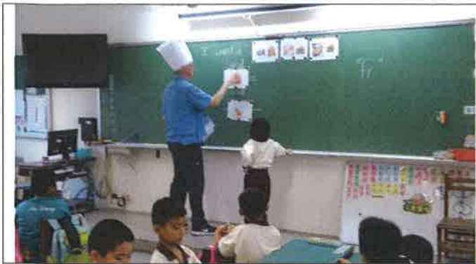
1071029 安東國小外師訪視觀課 2