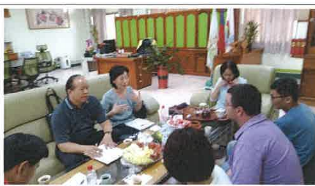
1080418 和興外師訪視座談