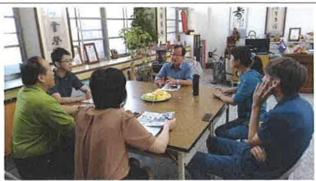
1080417 雙溪國小外師訪視座談