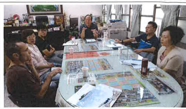
1071109 三和外師訪視座談