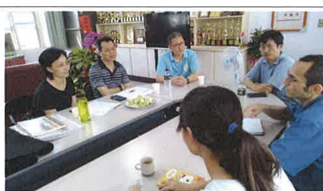
1080425 灣潭國小外師訪視座談