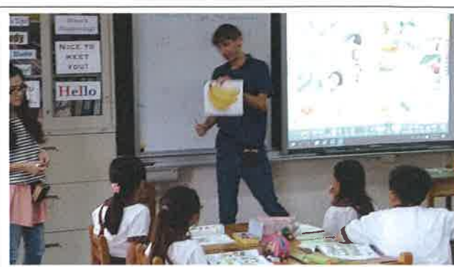
1071112 祥和外師訪視觀課 1