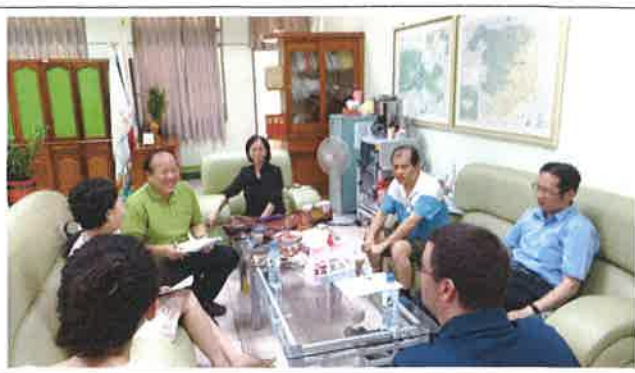
1070517 和興國小外師訪視座談