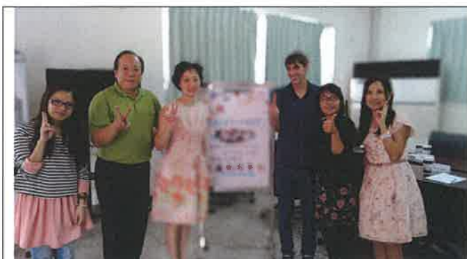
1071112 祥和外師訪視合影