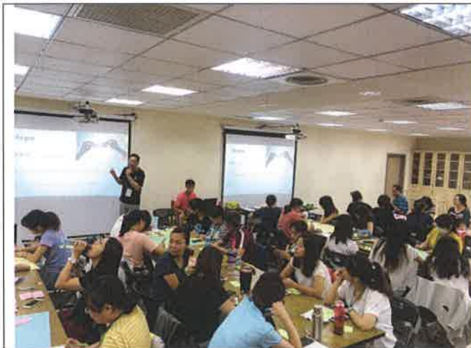
1072 夢 N 英語教學 1