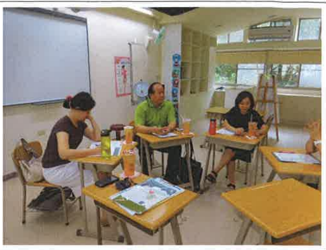
1070508 文光國際英語村外師訪視座談