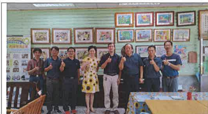
1070518 三興國小外師訪視合影