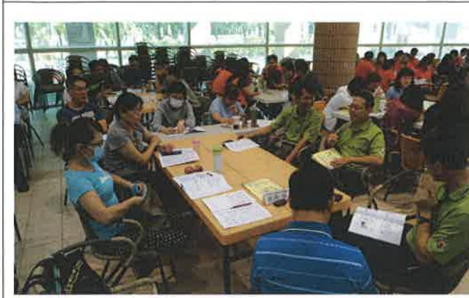
107 小組教學研討會 2