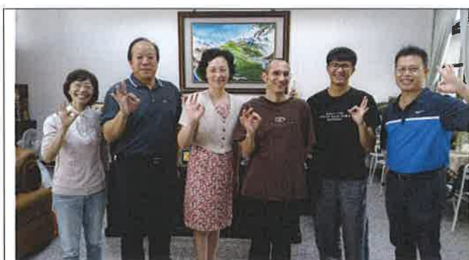
1071109 三和外師訪視合影