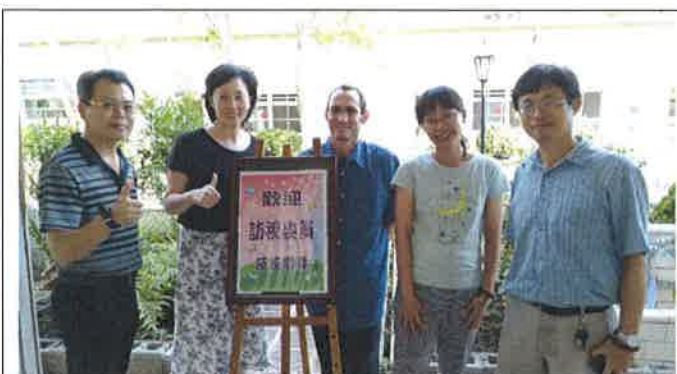
1080425 灣潭國小外師訪視合影