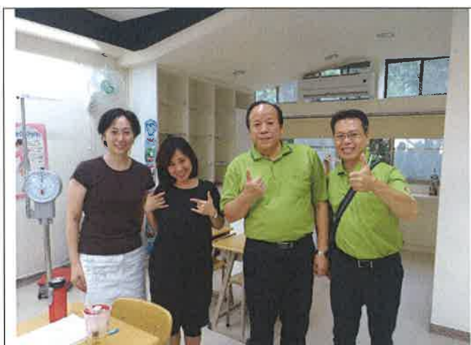
1070508 文光國際英語村外師訪視合影