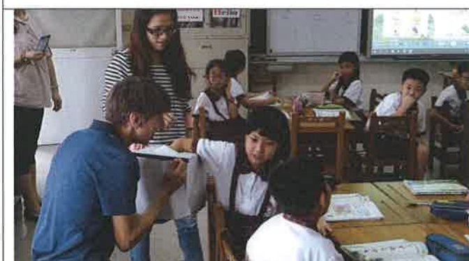
1071112 祥和外師訪視觀課 2