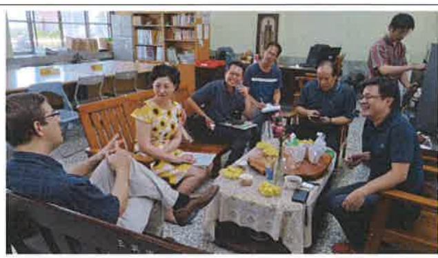
1070518 三興國小外師訪視座談