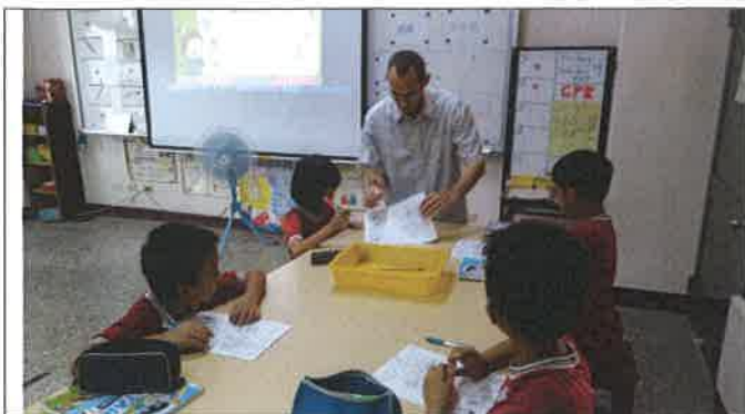
1071109 三和外師訪視觀課 2