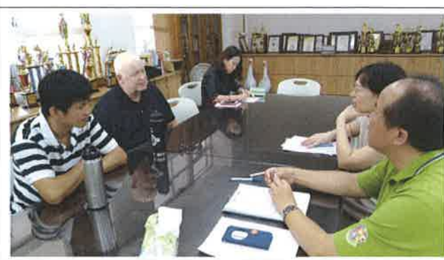
1071029 民雄國小外師訪視座談