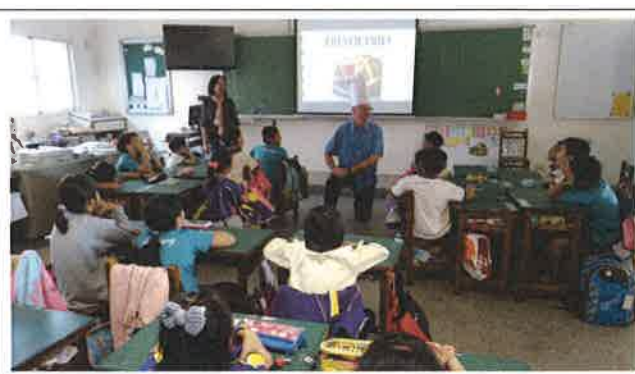
1071029 安東國小外師訪視觀課 1