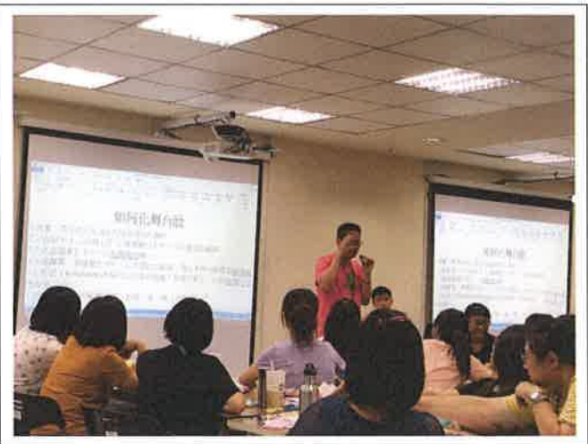
1072 夢 N 英語教學 2