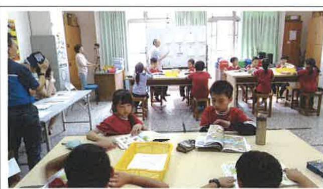
1071109 三和外師訪視觀課 1