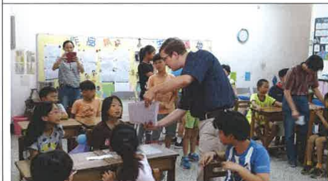
1070518 三興國小外師訪視觀課 2