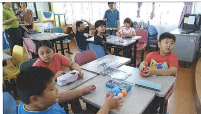
1080417 雙溪國小外師訪視觀課 2