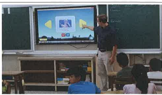
1070518 三興國小外師訪視觀課 1