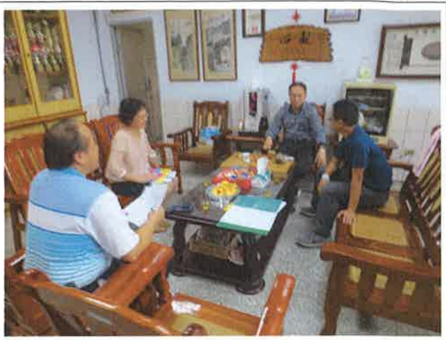
1071112 黎明外師訪視座談