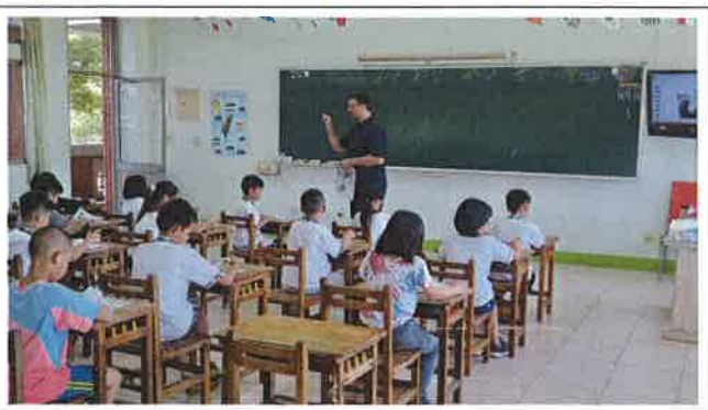
1070517 和興國小外師訪視觀課 1