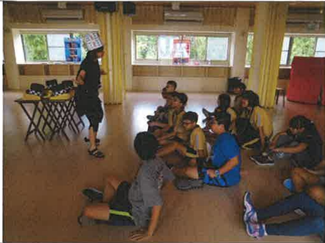
1070508 文光國際英語村外師訪視觀課 2