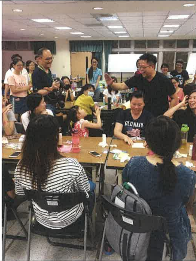
1072 夢 N 英語教學 3