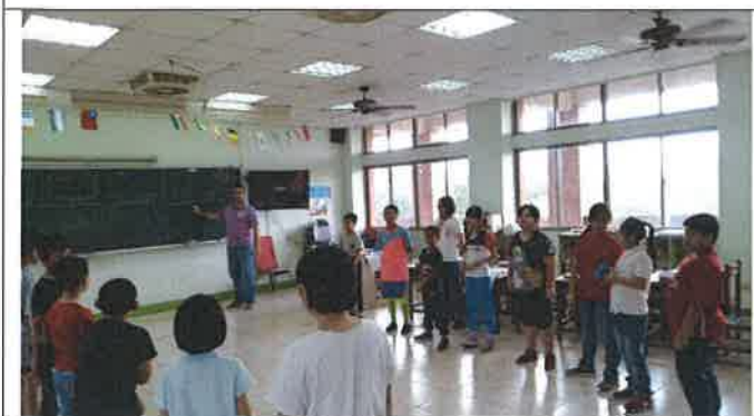
1080418 和興外師訪視觀課 2