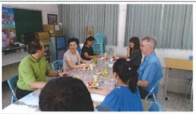
1070510 大崙國小外師訪視座談