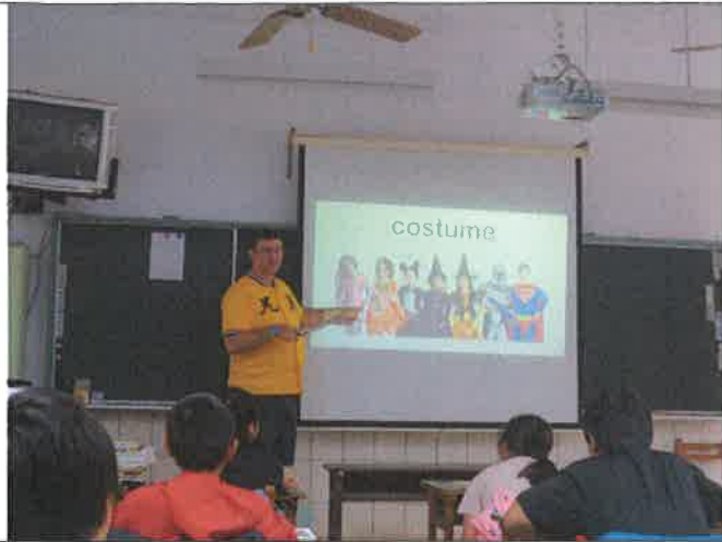
1071112 黎明外師訪視觀課 2