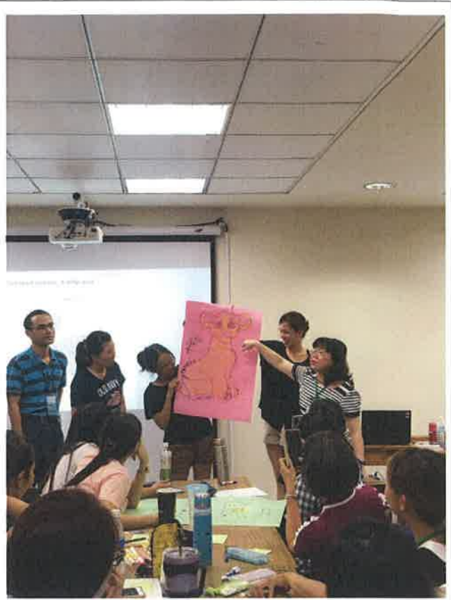
1072 夢 N 英語教學 4