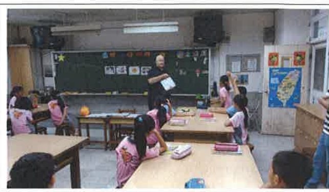
1071029 民雄國小外師訪視觀課 1