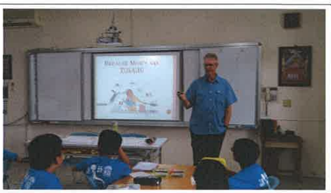
1070510 大崙國小外師訪視觀課 1