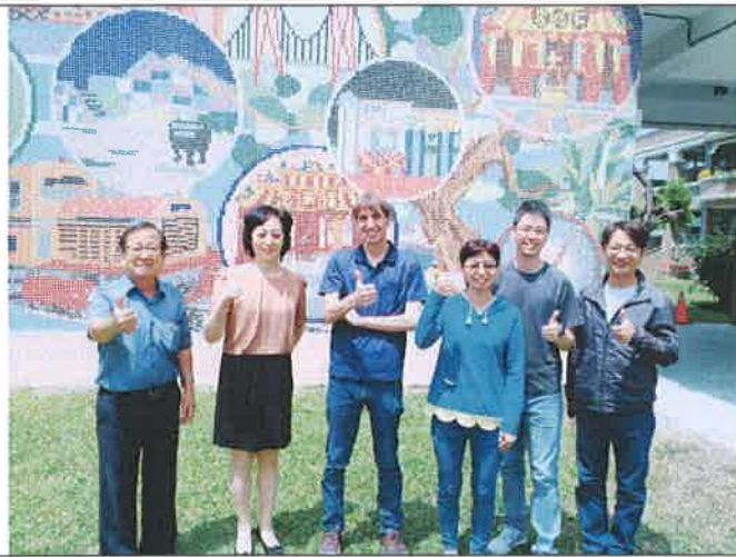
1080417 雙溪國小外師訪視合影