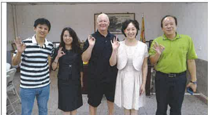
1071029 民雄國小外師訪視合影