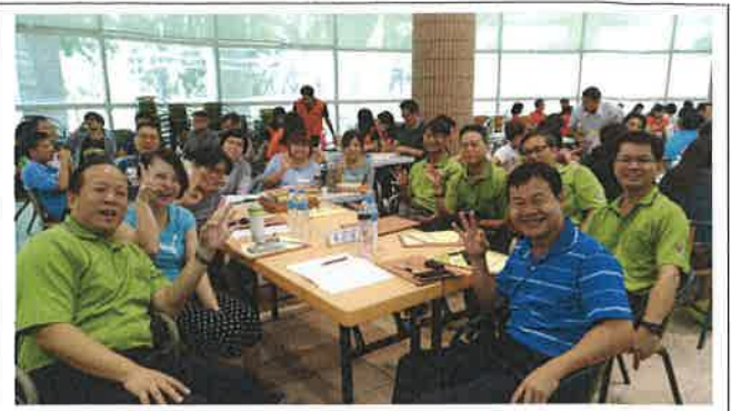
107 小組教學研討會 1