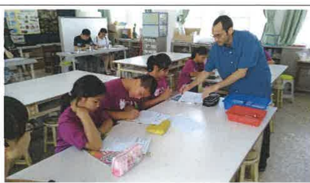
1080425 灣潭國小外師訪視觀課 1