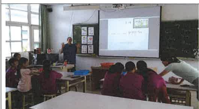
1080425 灣潭國小外師訪視觀課 2