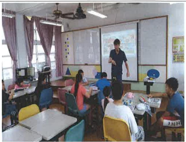
1080417 雙溪國小外師訪視觀課 1