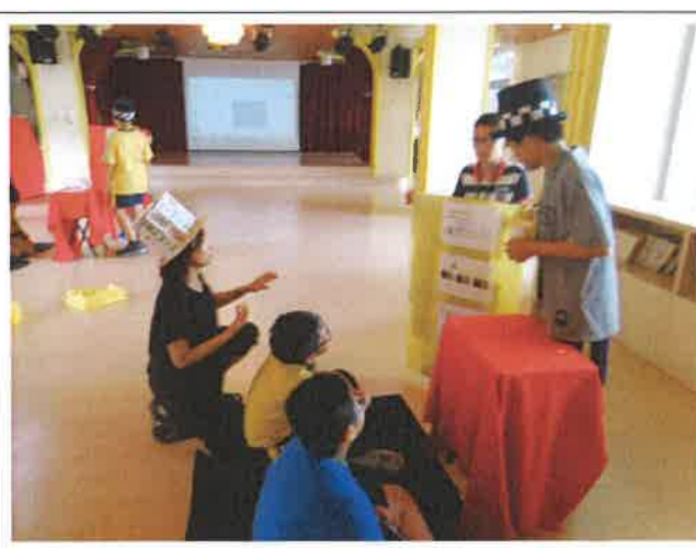
1070508 文光國際英語村外師訪視觀課 1