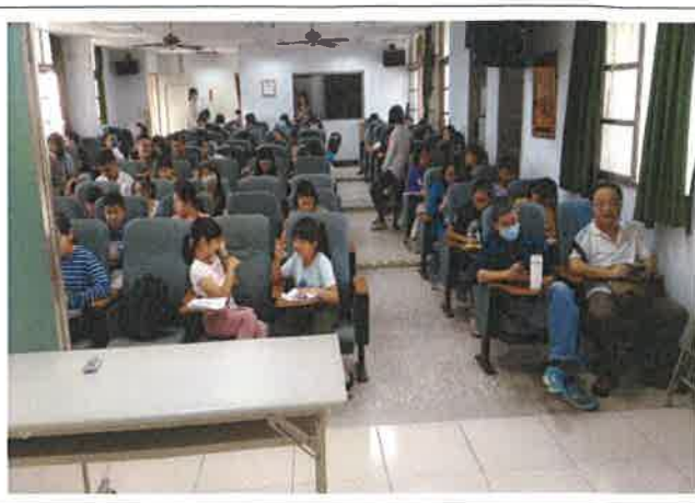
英語單字比賽第二區賽場休息區