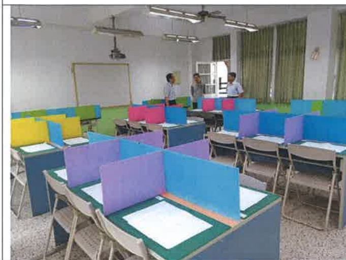
英語單字比賽第三區場地