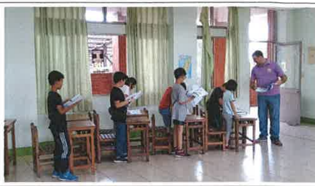
1080418 和興外師訪視觀課 1