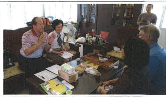
1071029 安東國小外師訪視座談