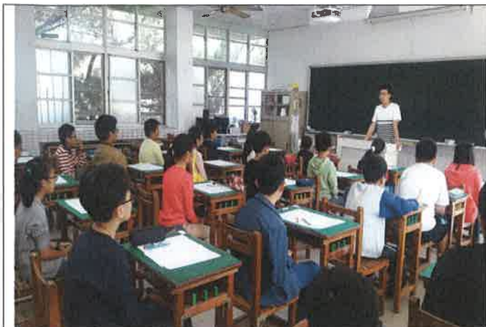
英語單字比賽第一區場地說明試場規則