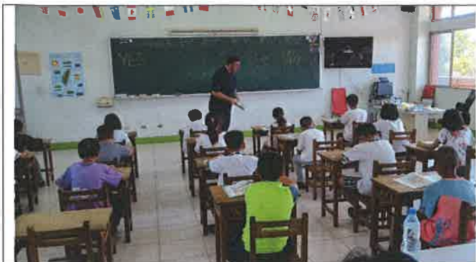
1070517 和興國小外師訪視觀課 2