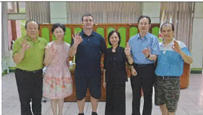
1070517 和興國小外師訪視合影