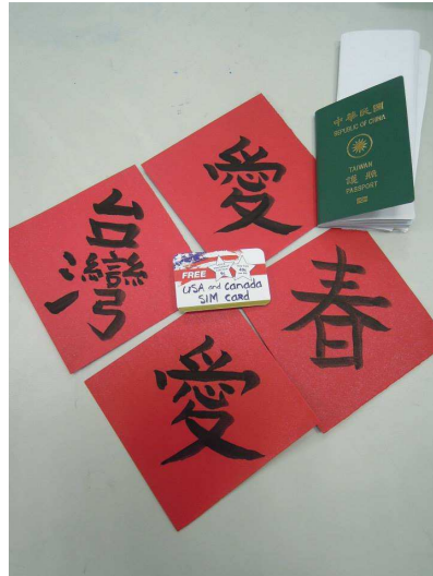
分給國外友人的自製春聯

美國大學生的學習態度與風氣十分主動與積極，在課堂進行時採取自由發問與開放式學習，學生可以隨時在上課向老師提問，老師也會利用和學師進行討論在這次暑期進修也結交了德國、義大利、美國當地的大學生朋友，除了介紹台灣文化讓他們知道之外，也透過直接的全英語授課，增長了自己的英文能力，最後感謝教育部的資金補助與嘉義縣教育處的幫忙，讓我得以完成短暫的留學