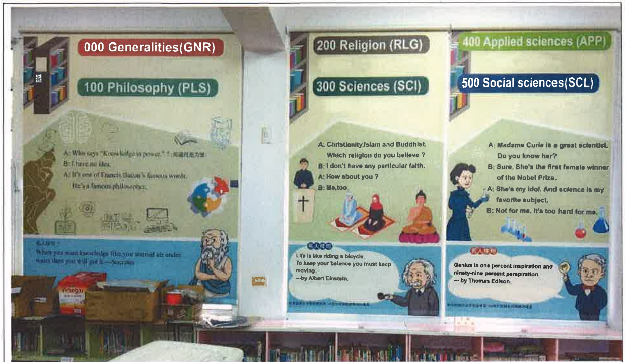
校園英語情境建置-英語會話捲軸式窗簾(第一個到第三個窗簾)，提供學生不同英語學習情境，情境豐富教學形式，縮短城鄉差距。