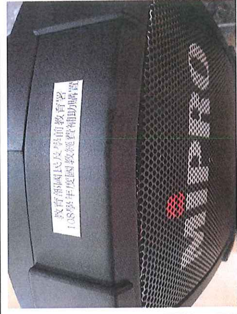
1. MA-101 肩背式麥克風