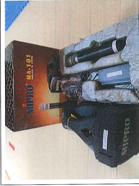
1. MA-101 肩背式麥克風